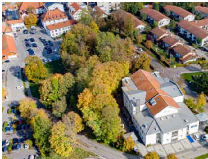
Waitzinger Keller mit Waitzinger Park