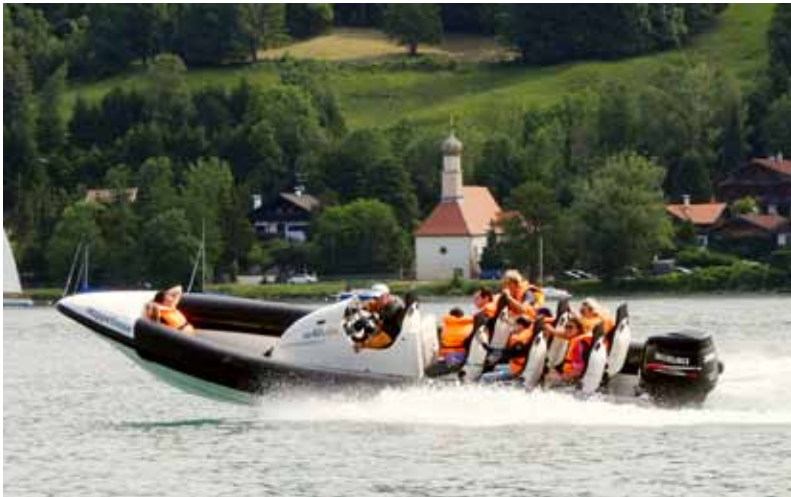
Die „Hoppetosse“ auf dem Tegernersee